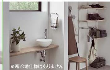
※寒冷地仕様はありません