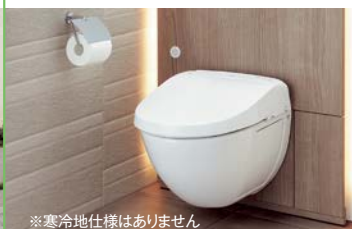
※寒冷地仕様はありません