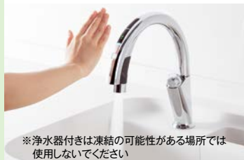
※浄水器付きは凍結の可能性がある場所では使用しないでください