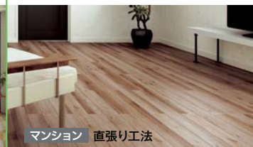
マンション 直張り工法